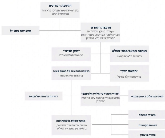
תרשים 1: מבנה תנועת חמאס (תורגם מתוך Robinson, 2023)

5. הנהגת חמאס בבתי הכלא : הנהגת חמאס בבתי הכלא בישראל (Robinson, 31.10.23).